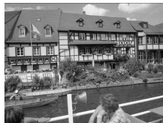
Hafenerundfahrt und Klein- Venedig

Auf der Heimfahrt kehrten wir bei herrlichem Sonnenschein im Biergarten in Schederndorf ein, wo jeder den Tag noch einmal Revue passieren lassen konnte.